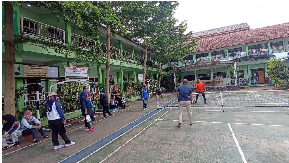
Gambar 2. Dokumentasi Pelaksanaan Kegiatan

Berdasarkan hasil kegiatan pengabdian ini, menunjukkan bahwa apa yang diajukan dalam perumusan masalah dapat terlaksana dengan baik. Dari hasil pelaksanaan kegiatan ini menemukan jawaban bahwa minat para guru PJOK SD di wilayah Citeureup Kota Cimahi untuk mengetahui tambahan pengetahuan pelatihan teknik dan peraturan permainan pickleball sangatlah tinggi, walaupun dalam kegiatan sebelumnya mereka belum memahami dan menguasai materi teknik dasar dan aturan pickleball. Kesempatan yang sangat berharga ini tidak disia-siakan walau disadari bahwa mulai dari sarana dan peralatan kegiatan ini sangatlah terbatas. Tetapi dengan semangat yang kuat dan dorongan dari para pelatih dan dosen maupun guru olahraga, menjadikan kegiatan ini menjadi kegiatan yang bermanfaat.