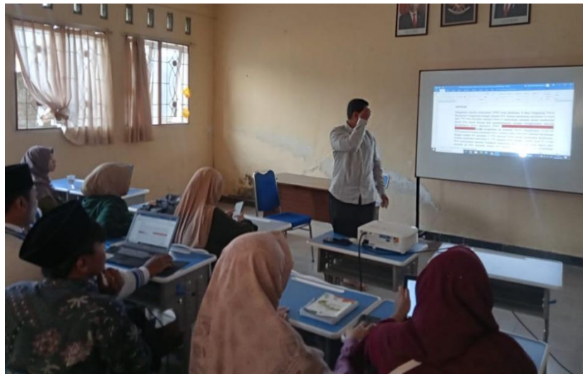
Gambar 2. Review Artikel Peserta

Meskipun demikian, hal tersebut tidak menjadi masalah karena memiliki tujuan dan makna yang sama.