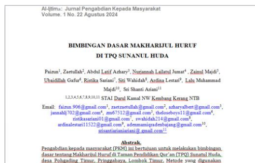
Gambar 3. Jurnal siap disubmit

Secara umum, sistematika penulisan artikel ilmiah tidak mengalami kendala, karena setiap artikel telah disusun berdasarkan template yang telah disediakan. Ketegasan dan kejelasan dalam artikel ilmiah menjadi aspek penting, karena berperan dalam meyakinkan pembaca bahwa artikel yang disusun didasarkan pada fakta dan teori yang ada. Konsisten, peserta pendamping masih kurang dalam kekonsistensi, baik dari segi Bahasa, tata tulis dan format penulisan. Sehingga kita mengarahkan mereka agar menulis harus konsisten. Karena konsistensi dalam karya ilmiah dapat meningkatkan keprofesionalisme karya dan memudahkan pembaca memahami referensi.