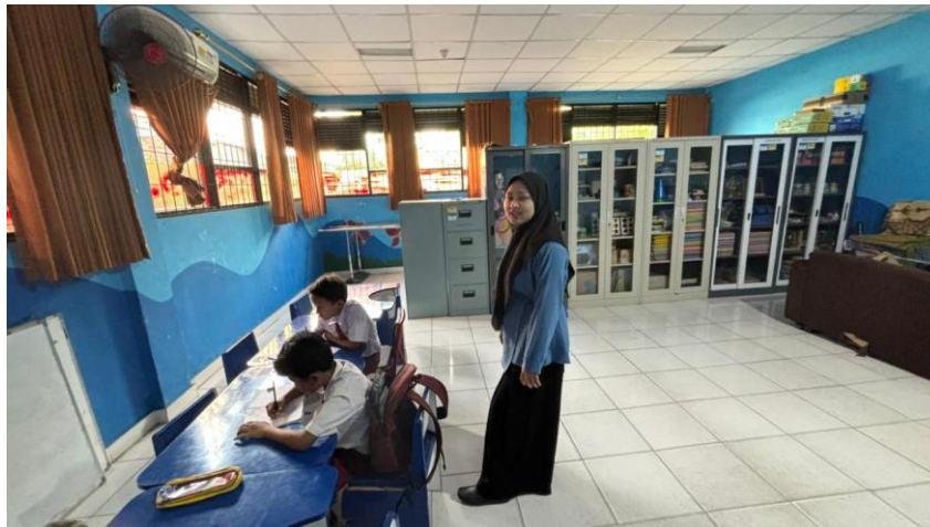
Gambar 6. Kegiatan Pembelajaran di Ruang Inklusi

Meskipun belum semua guru menunjukkan perubahan seragam, sebagian besar telah memperlihatkan inisiatif dalam mengubah pola komunikasi dan pengelolaan kelas. Beberapa guru yang sebelumnya cenderung bersikap otoriter kini tampak lebih sabar dan memberikan waktu tambahan untuk siswa yang memerlukan bantuan.