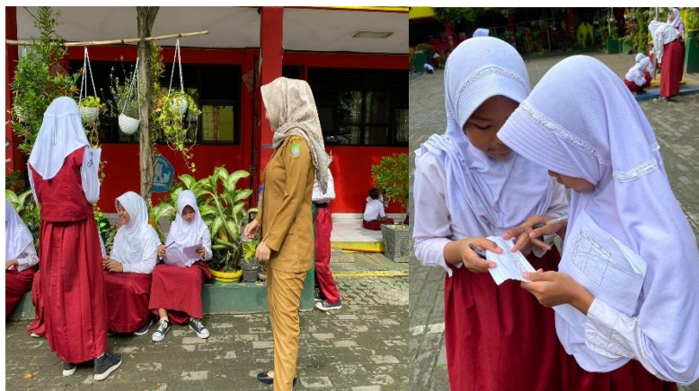
Gambar 3. Observasi Kegiatan Pembelajaran Inklusif

Observasi dilakukan untuk mengamati secara langsung perubahan perilaku mengajar guru serta implementasi materi pelatihan dalam praktik nyata. Hasil observasi menunjukkan adanya perkembangan positif pada keterlibatan guru dalam pembelajaran yang lebih adaptif dan inklusif.