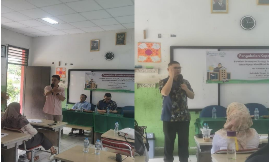
Gambar 4. Sesi Pelatihan Pembelajaran Inklusi

Pada sesi pelatihan hari pertama, sebagian besar guru terlihat pasif dan cenderung menganggap topik inklusi sebagai hal yang rumit dan “khusus untuk guru pendidikan luar biasa.” Namun, setelah sesi simulasi dan diskusi kelompok berlangsung, partisipasi meningkat. Guru mulai terlibat aktif dalam berbagi pengalaman, terutama saat diberikan studi kasus tentang siswa dengan hambatan konsentrasi dan gangguan pemrosesan informasi.