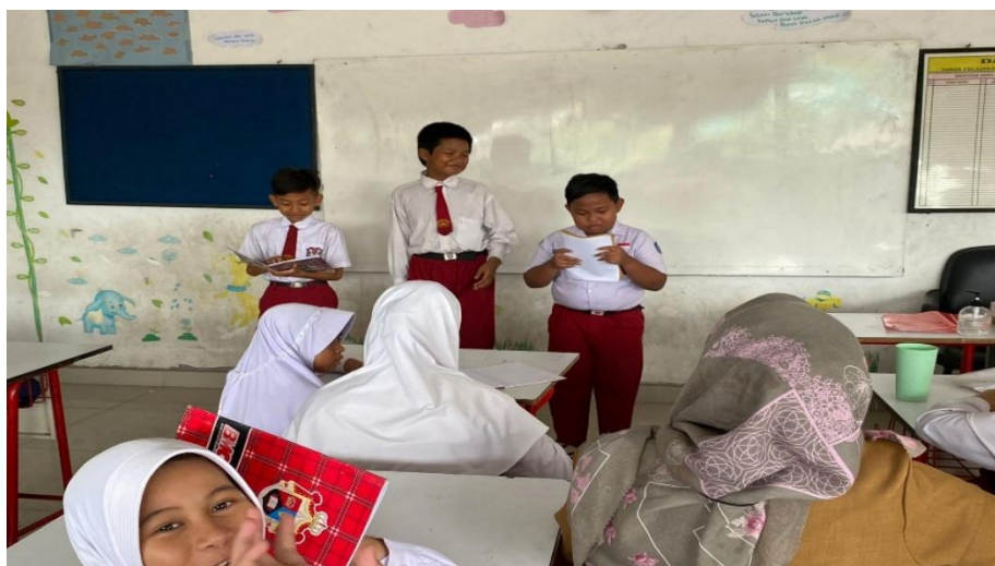
Gambar 5. Observasi Kegiatan Pembelajaran Inklusi di dalam kelas

Selama observasi di kelas setelah pelatihan, terlihat bahwa sebagian guru mulai mengadopsi teknik diferensiasi pembelajaran. Salah satu guru membuat dua versi lembar tugas. Versi standar untuk sebagian besar siswa, dan versi sederhana dengan petunjuk gambar bagi siswa yang menunjukkan kesulitan membaca. Dalam beberapa kelas, guru juga mulai mengatur tempat duduk berdasarkan kebutuhan siswa, memisahkan siswa yang mudah terganggu dan menempatkannya lebih dekat ke papan tulis agar lebih fokus, seperti yang direkomendasikan dalam pelatihan.