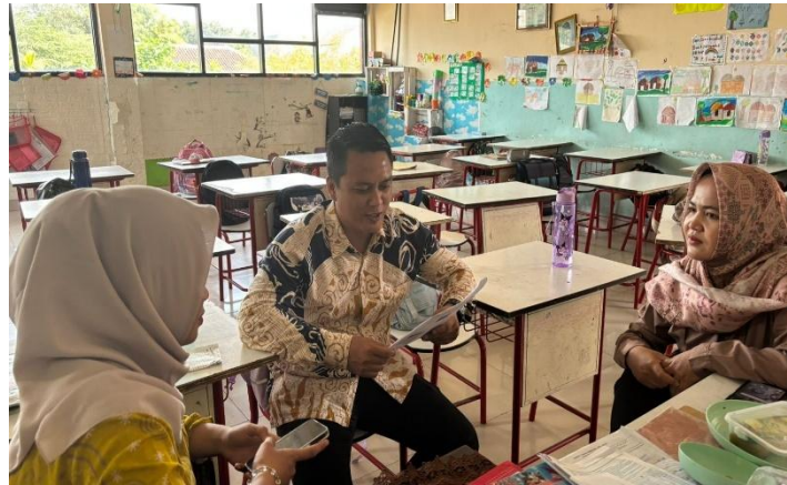
Gambar 2. Wawancara mendalam bersama Guru SDN Benda

Berdasarkan hasil wawancara dengan sejumlah guru sebelum mengikuti pelatihan, ditemukan bahwa mayoritas guru menunjukkan rendahnya pemahaman terhadap konsep inklusi.