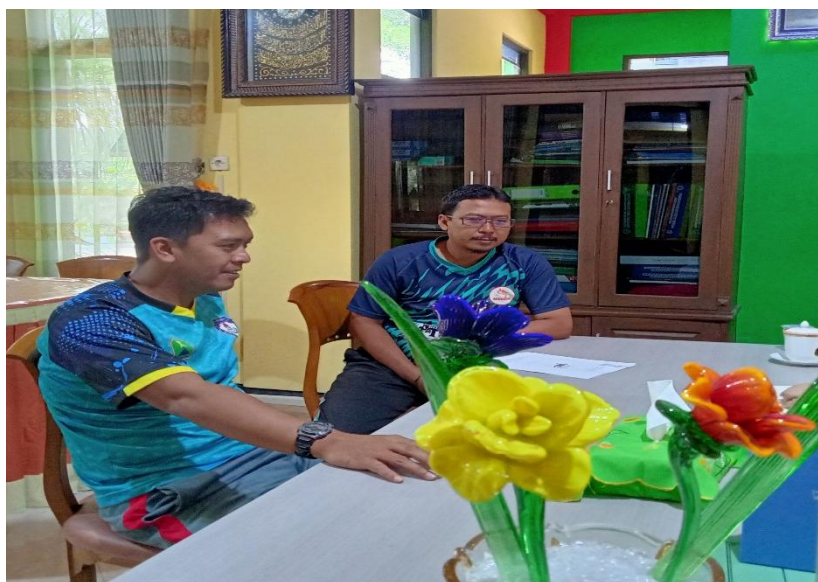
Gambar 5. Komunitas Belajar PJOK

Selain pada Komunitas Belajar Kelas 4 kegiatan lain juga ada pada Komunitas Belajar PJOK sebagaimana gambar berikut ini: