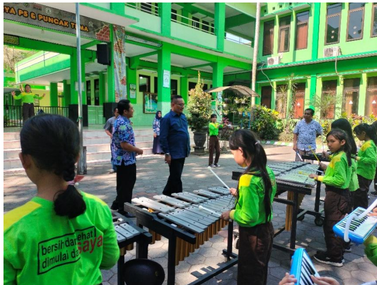
Gambar 2. Siswa menggunakan fasilitas yang ada di Sekolah

Sebagaimana yang diungkapkan oleh Kepala Sekolah Dra. Anita Rosemaria, M.Pd, bahwa siswa nantinya bisa menggunakan seluruh sarana prasarana dan aplikasi Google ini secara gratis di sekolah. Dan tentunya akan mempermudah guru untuk menyampaikan pembelajaran kepada siswa dengan fasilitas ini, sebagaimana pada gambar berikut ini: