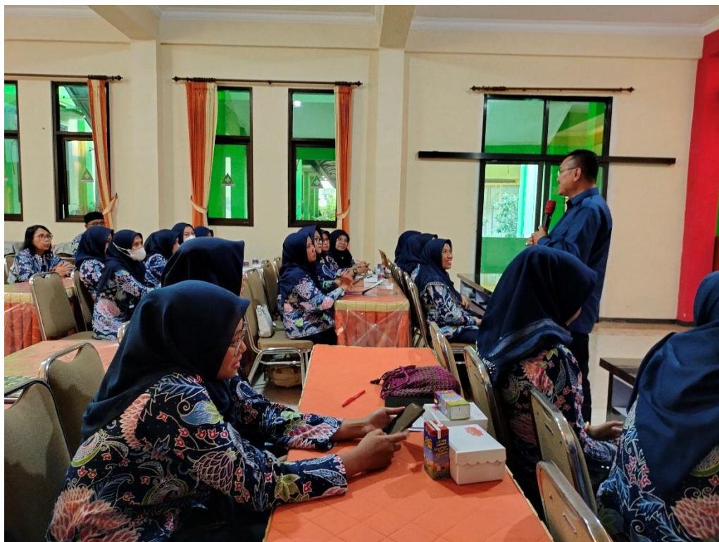
Gambar 6. Pelatihan Guru dan Tenaga Kependidikan SDN Model Kota Malang

Dalam kegiatan ini membahas terkait peningkatan kapasitas guru dalam melakukan pembelajaran di kelas maupun luar kelas. Dengan berkegiatan ini peserta merasa sangat termotivasi dan akan mengimplementasikan apa yang sudah didapatkan untuk meningkatkan proses pembelajaran di kelas agar mendapatkan dampak pembelajaran yang berfokus kepada peserta didik. Hal ini sesuai dengan apa yang disampaikan oleh Abdurahman, dkk. (2024) menjelaskan adanya korelasi positif yang signifikan antara partisipasi dalam Komunitas Belajar dengan peningkatan motivasi belajar guru. Dalam komunitas belajar tersebut akan terjadi transfer ilmu melalui berbagi praktik baik yang dilakukan dalam proses pembelajaran di kelas. Peningkatan motivasi belajar guru salah satu hal yang diperlukan untuk pengembangan kompetensi guru. Tentu hal ini berdampak terhadap peningkatan kualitas pembelajaran. Kegiatan pengembangan tersebut sebagaimana pada gambar berikut ini: