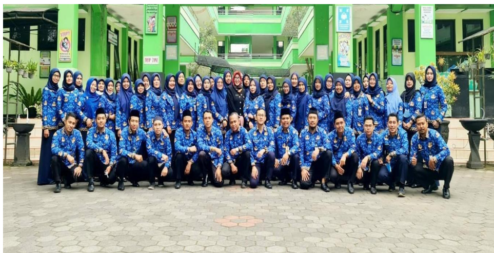
Gambar 3. Profil Guru SDN Model Kota Malang

Sekolah ini juga memiliki tenaga pendidik dan kependidikan yang mampu memberikan pendampingan kepada peserta didik secara berkelanjutan, artinya meskipun peserta didik sudah pulang dari sekolah masih adanya komunikasi antara guru kelas sebagai perwakilan sekolah kepada para orang tua peserta didik untuk memastikan ada keberlanjutan program pendampingan tersebut. Profil dari guru dan tenaga kependidikan di SDN Model Kota Malang sebagaimana pada gambar berikut ini: