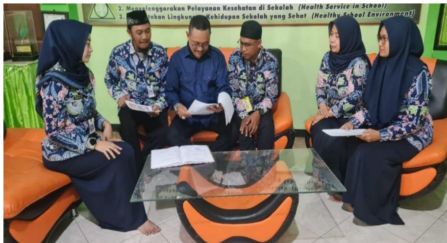
Gambar 4. Pendampingan Komunitas Belajar Kelas 4

Selain itu juga membahas perencanaan proses pembelajaran yang akan dilakukan pada pekan berikutnya. Sebagaimana yang telah dilakukan oleh pengabdian dalam mendampingi diskusi pada Komunitas Belajar Kelas 4 sebagaimana gambar di bawah ini: