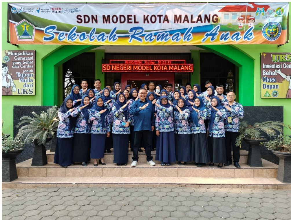
Gambar 7. Bersama Seluruh Guru dan Tenaga Kependidikan SDN Model Kota Malang

Komunitas Belajar di SDN Model Kota Malang telah terlaksana secara rutin setiap hari Jumat, mencakup dua jenis komunitas, yaitu Komunitas Belajar semua jenjang dan Komunitas Belajar Mata Pelajaran. Pelaksanaan kegiatan yang terjadwal ini mencerminkan sistem kerja yang sudah terorganisasi dengan baik serta menunjukkan adanya kesadaran kolektif dari seluruh pendidik dan tenaga kependidikan akan pentingnya pengembangan profesional berkelanjutan.