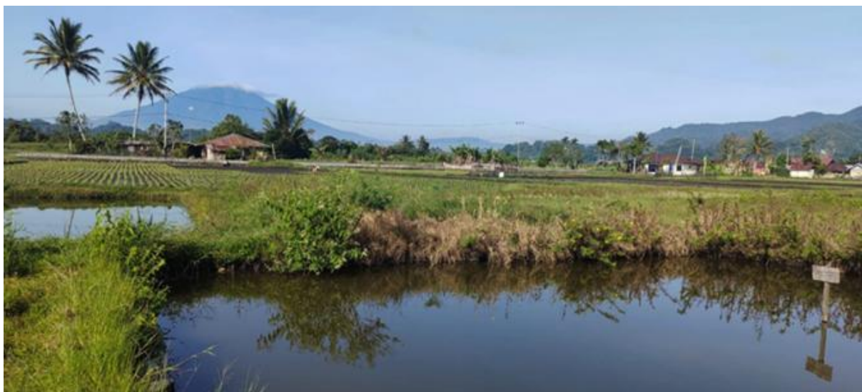
Gambar 2. Lokasi Dasawisma Melati 3

Tahap berikutnya adalah pelaksanaan sosialisasi dan penyuluhan yang dilaksanakan pada Minggu, 1 September 2024, dihadiri oleh 35 orang peserta yang terdiri dari perangkat nagari, kelompok dasawisma serta masyarakat sekitar. Pada kegiatan ini peserta diberikan edukasi mengenai konsep agrowisata, penerapan sustainable integrated farming , contoh-contoh sukses desa lain yang telah berhasil mengembangkan agrowisata, serta rencana pengembangan Kampung Tapi sebagai desa agrowisata. Tidak hanya memberikan edukasi, kegiatan sosialisasi juga dilanjutkan dengan sesi diskusi bersama masyarakat terkait rencana pengembangan desa agrowisata. Diskusi ini bertujuan untuk menggali masukan dari