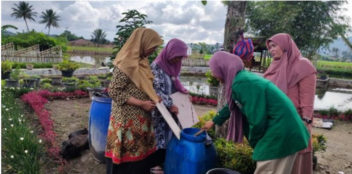
Gambar 5. Demonstrasi pembuatan pupuk kompos

memanfaatkan sumber daya lokal secara optimal dengan prinsip zero waste , seperti mengubah limbah pertanian menjadi pupuk organik.