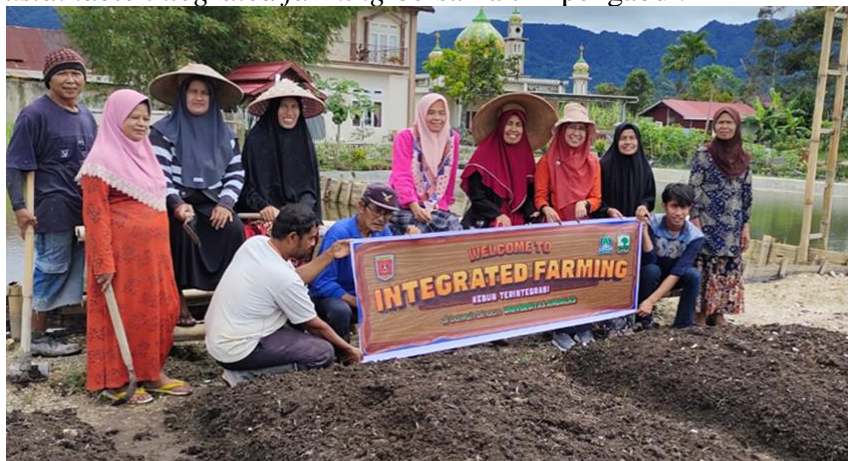
Gambar 4. Pelatihan sustainable integrated farming bersama kelompok Dasawisma

Tahap berikutnya adalah melakukan tahap implementasi, Langkah awal dalam tahap implementasi adalah memberikan mengadakan pelatihan praktis tentang teknik pembuatan sustainable integrated farming bersama kelompok Dasawisma. Selanjutnya kelompok Dasawisma ikut berperan aktif dalam kegiatan pengelolaan dan pengembangan lokasi percontohan sustainable integrated farming bersama tim pengabdian.