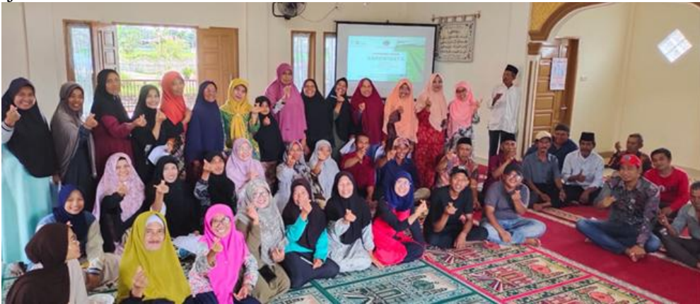
Gambar 3 Kegiatan Sosialisasi dan Penyuluhan Agrowisata Kampung Tapi

masyarakat setempat mengenai potensi, tantangan, dan harapan mereka terhadap pengembangan agrowisata, serta untuk memastikan bahwa rencana tersebut sesuai dengan kebutuhan dan keinginan masyarakat. Masyarakat menunjukkan antusiasme yang tinggi dan mendukung penuh rencana tersebut, bahkan mereka bersedia bergotong royong untuk membantu mewujudkan pengembangan desa agrowisata. Dengan partisipasi aktif dari warga, diharapkan pengembangan agrowisata di Kampung Tapi dapat berjalan dengan lebih baik dan berkelanjutan.