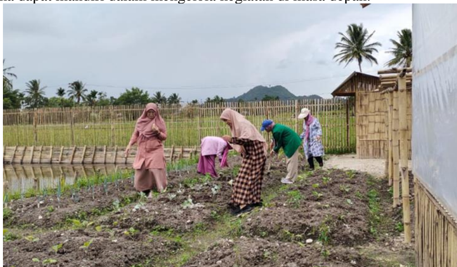
Gambar 6. Pendampingan proses penanaman benih

Evaluasi berkala juga dilakukan untuk menilai keberhasilan program dan memastikan kegiatan berjalan sesuai rencana. Dalam setiap sesi evaluasi, tim pengabdian memberikan umpan balik kepada kelompok Dasawisma untuk meningkatkan efisiensi dan produktivitas kegiatan. Evaluasi ini melibatkan diskusi terbuka dengan peserta untuk mengevaluasi apa yang telah berjalan baik dan apa yang perlu diperbaiki. Umpan balik yang diberikan tidak hanya berfokus pada aspek teknis, tetapi juga mencakup penguatan kelembagaan kelompok agar mereka dapat mandiri dalam mengelola kegiatan di masa depan.