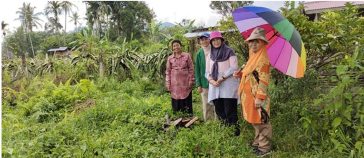
Gambar 1. Lokasi Dasawisma Melati 1

Pada tahap awal tim pengabdian melakukan survei lokasi untuk dijadikan lokasi percontohan Sustainable Integrated farming , Berdasarkan hasil survei dan diskusi tim pengabdian dengan ketua Dasawisma dipilih Dasawisma 3 sebagai lokasi untuk melakukan kegiatan sustainable integrated farming .