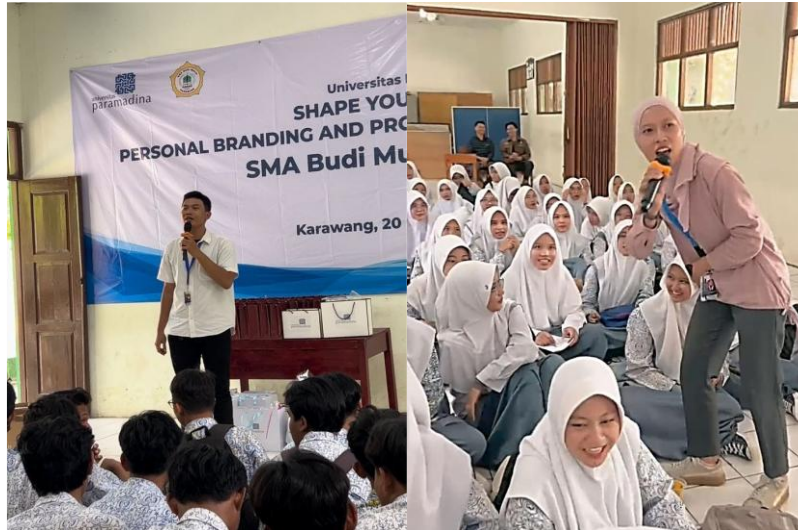
Gambar 3. Penyampaian materi kedua tentang teknik pembuatan CV

Pemateri juga menguraikan cara penulisan CV yang tepat untuk lembaga pemerintah, perusahaan rintisan, sektor swasta, dan organisasi internasional. Selanjutnya, pemateri mengeksplorasi pengetahuan serta pemahaman peserta mengenai CV melalui kegiatan pembuatan langsung dengan menggunakan aplikasi Canva yang populer dan mudah digunakan saat ini. Pembuatan CV dengan memanfaatkan aplikasi dapat menambah variasi desain yang turut mempercantik CV tersebut. Walaupun demikian, hal itu tidak mengubah fungsi utama CV yang menyimpan informasi pribadi dan aspek terkait pekerjaan yang ingin di lamar (Tiorina et al., 2022).