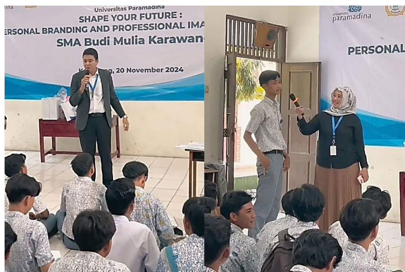
Gambar 5. Penyampaian materi keempat tentang praktik wawancara kerja

Pemateri menekankan pentingnya aspek yang harus diperhatikan dalam proses wawancara kerja, yang meliputi kemampuan untuk menyampaikan pemikiran dengan jelas, kemampuan berbicara secara komunikatif, kemampuan untuk menyampaikan ide dengan bahasa tubuh yang meyakinkan, serta kemampuan untuk berpenampilan dengan cara yang pantas.