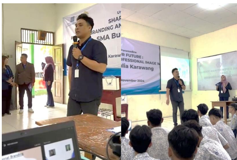
Gambar 2. Penyampaian materi pertama tentang personal branding

Oleh karena itu, sangat penting bagi siswa untuk memahami tentang komunikasi, terutama terkait interaksi di dunia digital pada era saat ini. Salah satu cara yang bisa dilakukan adalah dengan memberikan wawasan dan pengetahuan tentang cara mempresentasikan diri ketika beraktivitas di dunia maya, serta bagaimana membangun citra diri yang baik agar siswa lebih berhati-hati dalam menunjukkan identitas mereka di dunia digital (Aini & Iskandar, 2024).