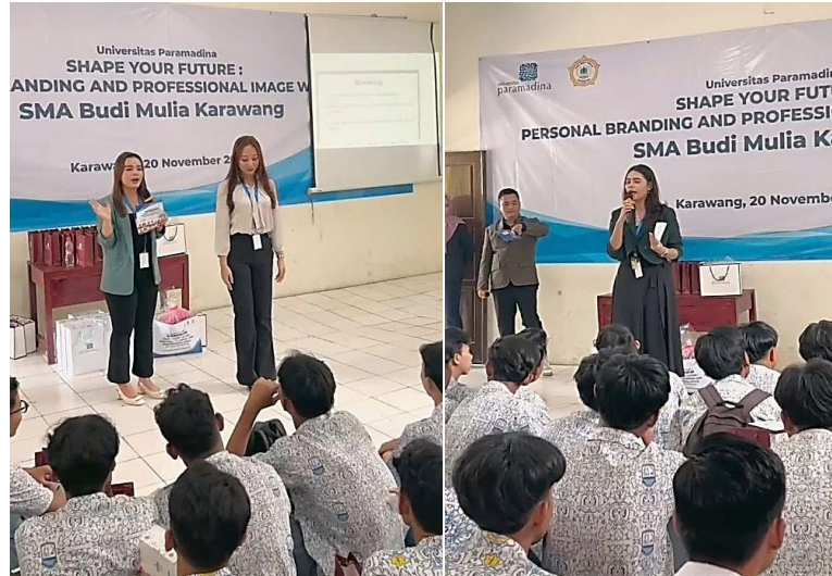
Gambar 4. Penyampaian materi ketiga tentang professional grooming