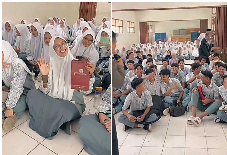
Gambar 6. Antusiasme para siswa dan siswi peserta pelatihan soft skill

Kegiatan ini mendapat sambutan antusias yang baik dari peserta. Hal ini dapat dilihat dari banyaknya peserta yang mengikuti dan aktif berpartisipasi selama kegiatan berlangsung. Peran aktif siswa kelas XII SMA Budi Mulia dalam tanya jawab dengan pemateri juga menjadi salah satu indikator keberhasilan kegiatan ini. Kegiatan pelatihan ini diharapkan dapat mengenalkan dan memicu siswa untuk terus membangun rasa percaya diri melalui personal branding , memahami dan dapat membuat CV yang menarik, memiliki wawasan terkait berpenampilan dan bersikap secara profesional, serta dapat menjalani wawancara pekerjaan dengan baik dan percaya diri menampilkan kemampuan yang dimiliki.