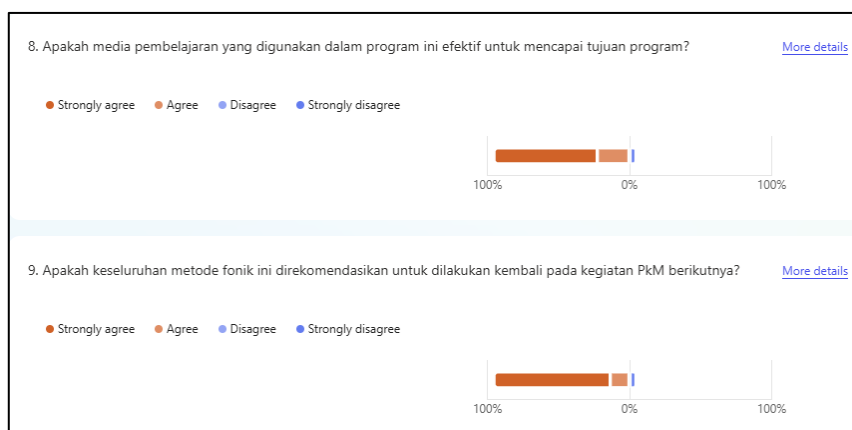
Gambar 4: Hasil Evaluasi

Beberapa dokumentasi kegiatan berikut menggambarkan proses pelaksanaan program yang telah berlangsung setiap hari Sabtu. Mulai dari pembagian kelompok belajar, pendampingan oleh mahasiswa tutor, keterlibatan aktif siswa, hingga sesi penutupan yang