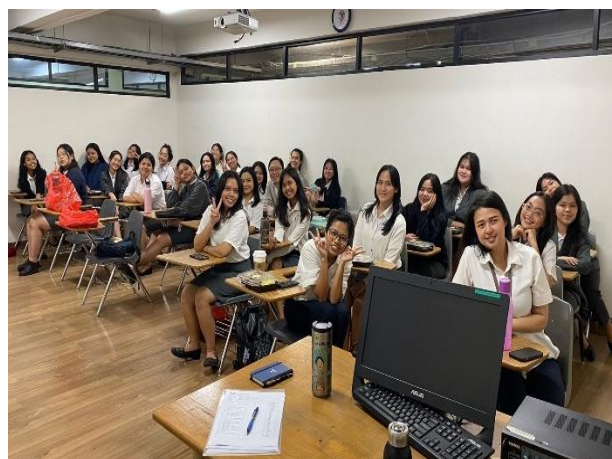
Gambar 6 dan 7: Foto Kegiatan

Program PKM peningkatan kemampuan membaca bahasa Inggris berbasis fonik di SDN Cihuni III telah dilaksanakan selama delapan minggu pada Januari–Maret 2025.