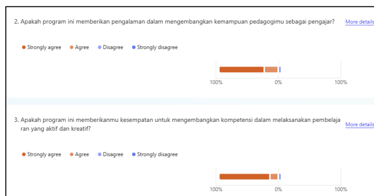
Gambar 1: Hasil Evaluasi

Berikut ini merupakan hasil survei yang dilakukan kepada para mahasiswa tutor berjumlah 23 orang, berdasarkan pengalaman mereka dalam mengajar, hasil observasi terhadap peningkatan kemampuan siswa, serta evaluasi menyeluruh terhadap program PkM ini.