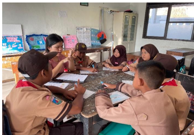
Gambar 5 dan 6: Kegiatan Belajar