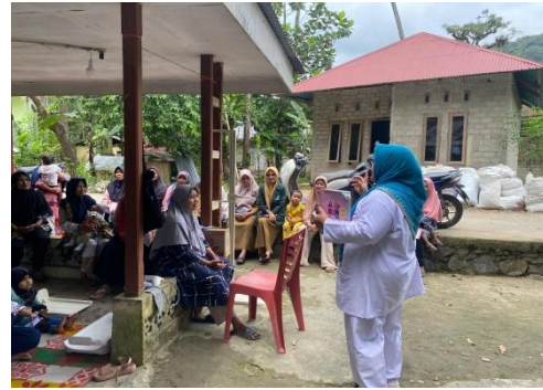
Gambar 3. Sosialisasi dan FGD