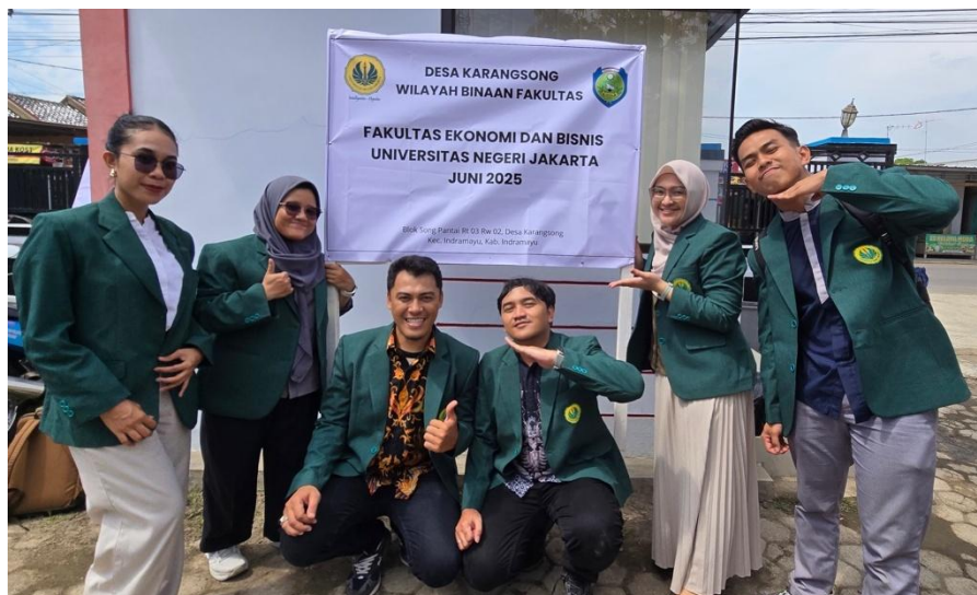
Gambar 5. Pemasangan Plang Pengabdian Masyarakat FEB UNJ di Desa Karangsong, Kabupaten Indramayu, Jawa Barat

Dengan demikian, kegiatan pengabdian masyarakat Fakultas Ekonomi dan Bisnis (FEB), Universitas Negeri Jakarta (UNJ) di Desa Karangsong, Kabupaten Indramayu, Jawa Barat berlangsung dengan baik. Selain meningkatkan penerahuan, kegiatan ini juga meningkatkan kesadaran awal terhadap pemahaman perilaku konsumen di era Digital saat ini. Pada kegiatan ini juga menghasilkan sebuah komitmen bersama antara FEB UNJ dan Dinas Perikanan dan