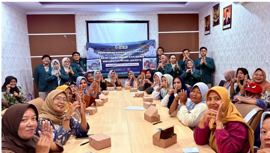
Gambar 4. Foto Bersama Pelaku UMKM Kabupaten Indramayu dengan Tim Pengabdian Masyarakat FEB UNJ