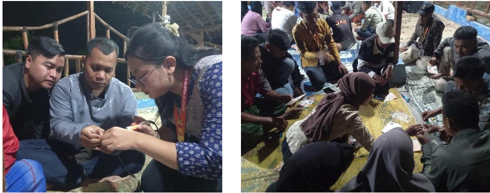
Gambar 3 Dokumentasi Proses Pembuatan Sensor Pendeteksi Api