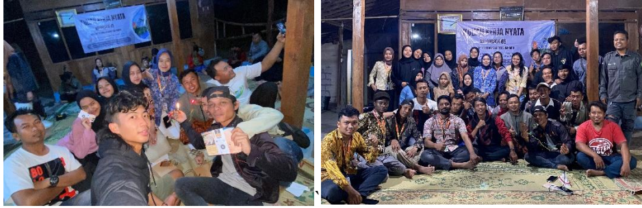
Gambar 4 Dokumentasi Pelaksanaan Pembuatan Sensor Pendeteksi Api

Dari sudut pandang keberlanjutan dan pemberdayaan masyarakat, keterlibatan Karang Taruna dalam kegiatan ini sangat berarti. Mereka tidak hanya berperan sebagai peserta pelatihan teknis, tetapi kini bertransformasi menjadi pengelola inti sistem melalui integrasi program sensor sebagai Unit Jasa Digital di bawah Badan Usaha Milik Desa (BUMDes). Pelembagaan ini menjamin kelangsungan operasional sistem melalui mekanisme cost recovery dan alokasi anggaran yang berkelanjutan, mengubah teknologi dari beban biaya menjadi aset Smart BUMDes . Di masa mendatang, pemberdayaan Karang Taruna akan difokuskan pada technopreneurship melalui pelatihan vokasi lanjutan dalam bidang IoT, mikrokontroler, dan manajemen data (KSA/A). Keterampilan ini memungkinkan mereka mengembangkan solusi berbasis sensor (misalnya, sistem akuaponik otomatis) dan mengelola aset digital desa, sekaligus mendorong terciptanya inovasi yang sesuai dengan kebutuhan masyarakat dan membuka peluang wirausaha baru.