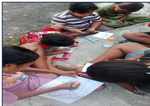
Gambar. 4 Mewarnai Gambar Kudus

Mewarnai gambar kudus menjadi salah satu metode yang efektif dan menyenangkan bagi anak-anak, dengan tujuan agar anak-anak semangat dalam mengikuti kegiatan sekami. Dengan mewarnai gambar-gambar kudus yang sudah disiapkan dapat membantu anak-anak mengetahui gambar kudus siapa yang diwarnai dan kisah iman dari gambar tersebut. Hasil karya dari anak-anak menjadi penuh warna dalam bentuk ekspresi kegembiraan iman. Sukacita dan kegembiraan ini inti dari semangat misioner dalam membagi kabar baik dengan gembira.