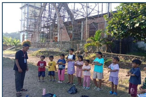
Gambar. 3 Menyanyi dan menari

Anak-anak sekami biasanya sangat menyukai jika melakukan animasi gerak dan bernyanyi bersama. Hal ini dilakukan guna menumbuhkan rasa semangat dan rasa percaya diri dalam diri anak tersebut. Hal ini memiliki tujuan lain yakni anak-anak akan terus bersemangat dalam mengikuti kegiatan sekami setiap minggunya. Dengan demikian hal ini adalah satu perwujudan meningkatkan iman anak dan semangat misioner dalam diri anak.