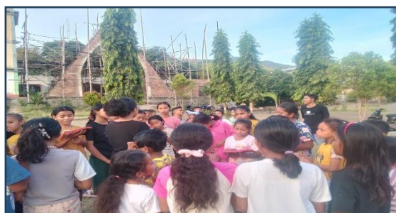
Gambar. 5 Latihan Nyanyi bersama

Dengan bernyanyi bersama dapat menciptakan suasana doa dan perjumpaan dengan Tuhan. Dengan hal ini dapat menyiapkan mental dan spiritual anak untuk memasuki tempat ziarah. Bernyanyi dalam bentuk paduan suara dapat melatih anak-anak untuk mendengarkan orang lain, menyatukan suara, dan dapat mencerminkan persatuan menjadi pilah dalam hidup beriman. Dengan berkatih nyanyi anak-anak tidak hanya menjadi peserta pasif saat kegiatan ziarah akan tetapi aktif dalam pelayanan selama perayaan berlangsung.