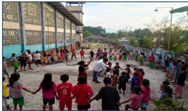
Gambar. 2 Bermain Game

Permainan edukatif merupakan sebuah permainan yang disukai oleh anak-anak karena gabungan dari hiburan dan pendidikan. Dalam permainan edukatif anak-anak tidak hanya diajarkan topik dan menguatkan dirinya sendiri, akan tetapi mereka juga harus bisa menunjukkan dan mengungkapkan kesenangan bersama dalam permainan yang dilakukan. Permainan edukatif memiliki peran guna membantu anak-anak untuk memahami sebuah konsep iman dengan cara yang lebih muda. Karena dengan permainan yang dilakukan oleh anak-anak dapat menciptakan sesuatu dalam pikiran mereka dan dihubungkan dengan tokoh atau gambar yang diambil dari cerita Kitab Suci yang dibaca dan diterapkan dalam kehidupan nyata mereka (Girsang, 2024). Permainan edukatif dilakukan dengan anak-anak sekami yakni Talking Stick . Talking Stick dimainkan dengan tongkat yang diputar dari satu anak ke anak yang lain. Pertanyaan akan diberikan ketika tongkat berhenti diover. Pertanyaan yang diberikan oleh tim pengabdian adalah pertanyaan berkaitan dengan cerita atau isi teks Kitab Suci.