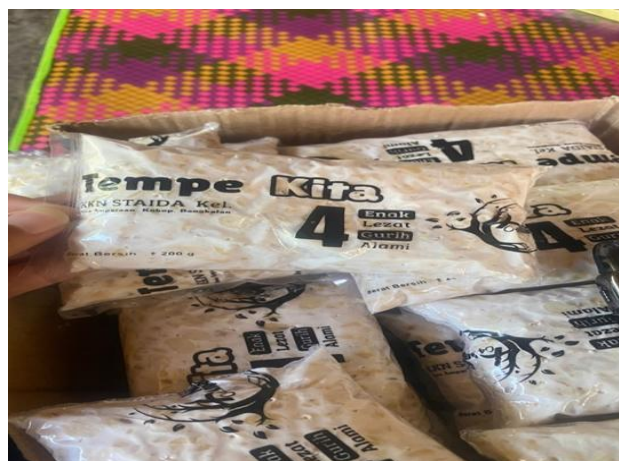
Gambar 4. Produk tempe hasil praktik mandiri peserta pelatihan di Dusun Batu Bintang, Desa Amparaan

Setelah pelatihan praktik berlangsung, hasil pendataan menunjukkan peningkatan yang signifikan: 21 peserta (35%) mampu memahami dan mempraktikkan pembuatan tempe secara mandiri, 37 peserta (62%) mampu mempraktikkan dengan sedikit pendampingan, dan hanya 2 peserta (3%) yang masih memerlukan bimbingan lebih lanjut. Peningkatan kapasitas ini menunjukkan bahwa metode pelatihan berbasis praktik langsung ( hands-on training ) efektif dalam mentransfer keterampilan teknis kepada peserta dengan latar belakang pendidikan yang beragam.