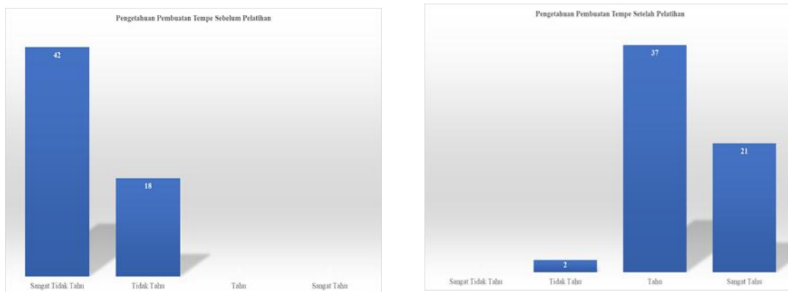
Gambar 3. Diagram tingkat pengetahuan dan kemampuan peserta sebelum (setelah penjelasan awal) dan setelah pelatihan praktik mandiri (n=60)

Sebelum pelatihan dimulai, tim pelaksana melakukan pendataan awal untuk memetakan kondisi kemampuan peserta. Perlu ditegaskan bahwa sebelum pelatihan dilaksanakan, seluruh 60 peserta belum memiliki pengetahuan maupun pengalaman dalam pembuatan tempe secara mandiri. Pendataan kemampuan yang tersaji pada Gambar 3 dilakukan setelah sesi pengenalan awal yakni setelah peserta menerima penjelasan dasar materi dan demonstrasi awal oleh fasilitator, namun sebelum praktik mandiri dilakukan. Oleh karena itu, klasifikasi "baik" dan "cukup" pada data pra-pelatihan dalam diagram mencerminkan pemahaman konseptual awal peserta setelah menerima penjelasan dasar, bukan kemampuan mandiri yang dimiliki sebelum program dimulai.