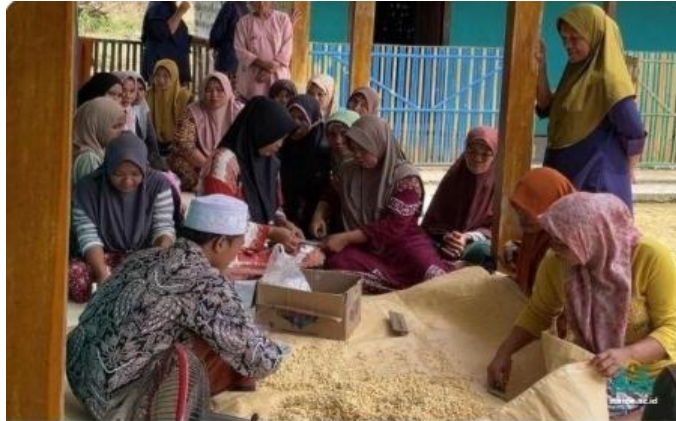
Gambar 1. Antusiasme peserta dalam mengikuti pelatihan produksi tempe di Dusun Batu Bintang, Desa Amparaan

Pelatihan dilaksanakan selama tiga hari berturut-turut di tiga dusun yang berbeda: Dusun Batu Bintang pada Minggu, 14 Desember; Dusun Nyato pada Senin, 15 Desember; dan Dusun Bujudan pada Selasa, 16 Desember. Pemilihan lokasi yang menyebar di tiga dusun bertujuan memberikan akses yang merata bagi seluruh warga tanpa terkendala jarak, sekaligus memperluas jangkauan pemberdayaan ekonomi di seluruh wilayah Desa Amparaan.