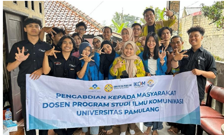
Gambar 1. Foto bersama warga Desa Sukajadi, tim dosen, dan tim mahasiswa

Metode yang diterapkan bersifat partisipatif dan berbasis komunitas, sehingga sejak awal mitra dilibatkan dalam pemetaan potensi, penentuan kebutuhan, hingga proses produksi konten promosi. Fokus program diarahkan pada pemecahan persoalan yang paling mendesak: keterbatasan literasi digital dan keterampilan narasi visual untuk promosi destinasi, serta kebutuhan penguatan tata kelola promosi dan pemahaman dasar manajemen usaha wisata berbasis komunitas.