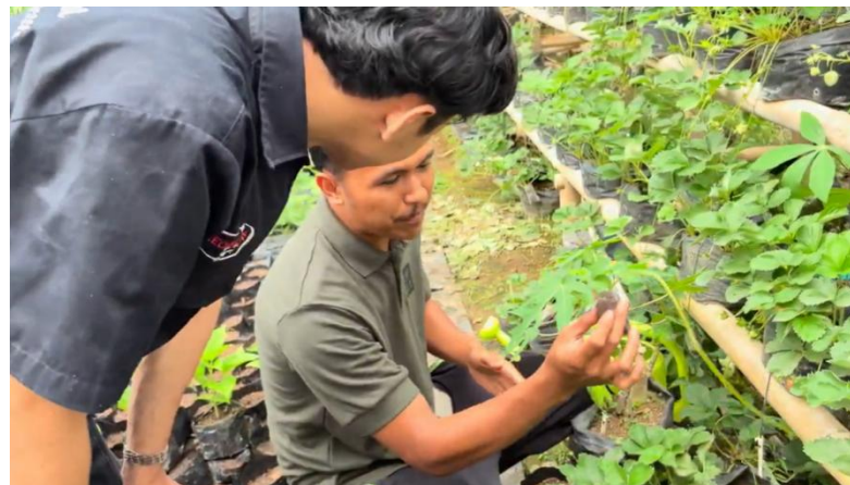
Gambar 2. Pengambilan dokumentasi mahasiswa memperoleh informasi wisata kebun Strawberi dari warga Desa Sukajadi