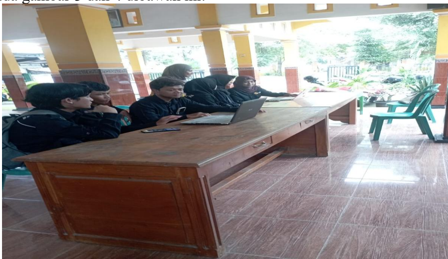
Gambar 3. Praktik mengeporasikan Coretax

Setelah memahami tampilan dashboard dan fitur-fitur utama, peserta diarahkan untuk melakukan simulasi pengisian SPT berdasarkan studi kasus perhitungan PPh orang pribadi. Tahapan pengisian SPT dimulai dari pembuatan konsep SPT, lalu pilih jenis pajak (PPh Final, PPh Orang Pribadi, PPh Ps 21/26 dan PPh Unifikasi). Pada kegiatan ini menggunakan contoh PPh orang pribadi yang dilanjut SPT Tahunan dan pilih Periode dan Tahun Pajak. Pada pengisian SPT akan dimulai dari pengisian SPT induk yang terdiri dari identitas diri, penghasilan neto, pajak terutang dan lain-lain. Lalu pengisian lampiran yang terdiri dari hutang, harta, kas dan lain-lain. Tahap terakhir adalah penyampaian SPT. Kegiatan ini menggunakan pendekatan praktik langsung ini memungkinkan peserta mengintegrasikan pemahaman teoritis dengan keterampilan aplikatif dengan digitalisasi perpajakan. Kegiatan praktik seperti disajikan pada gambar 3 dan 4 dibawah ini: