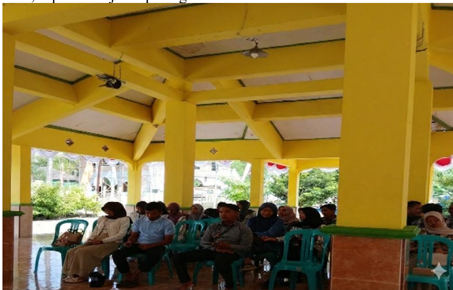
Gambar 1. Penyampaian materi kepada peserta kegiatan

Tahap pelaksanaan kegiatan dilakukan selama satu hari dengan pendekatan edukasi interaktif dan praktik langsung. Sebelum kegiatan dilaksanakan peserta diberikan materi, agar dalam kegiatan sosialisasi dan edukasi berjalan dengan lancar. Sesi awal berupa penyuluhan partisipatif yang menjelaskan urgensi pajak dalam pembangunan nasional, jenis-jenis pajak, serta kewajiban pelaporan pajak bagi wajib pajak orang pribadi dan badan untuk UMKM. Diskusi kelompok kecil dan sesi tanya jawab menunjukkan partisipasi aktif peserta, yang tercermin dari meningkatnya pemahaman konseptual mengenai fungsi pajak dan prosedur pelaporan SPT Tahunan. Peserta tidak hanya menerima informasi secara satu arah, tetapi juga terlibat dalam dialog yang mendorong refleksi terhadap pengalaman perpajakan yang selama ini dihadapi. Adapun kegiatan yang diikuti oleh peserta yang kebanyakan anak-anak muda dan pelaku UMKM, seperti disajikan pada gambar 1 di bawah ini: