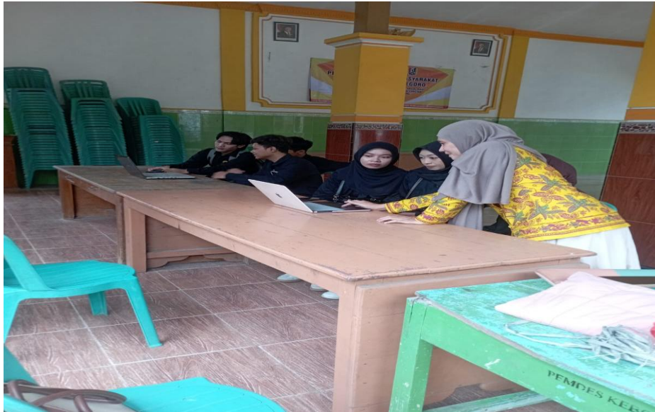
Gambar 4. Praktik mengeporasikan Coretax

Hasil pelaksanaan menunjukkan bahwa sebagian besar peserta mampu mengikuti tahapan penggunaan Coretax secara mandiri setelah memperoleh panduan yang sistematis. Peserta juga menunjukkan peningkatan kepercayaan diri dalam mengoperasikan sistem digital perpajakan. Meskipun demikian, beberapa kendala teknis masih ditemukan, khususnya pada peserta dengan keterbatasan pengalaman penggunaan perangkat digital. Kendala tersebut meliputi kesulitan dalam navigasi menu, pengunggahan dokumen, serta pemahaman alur validasi data.