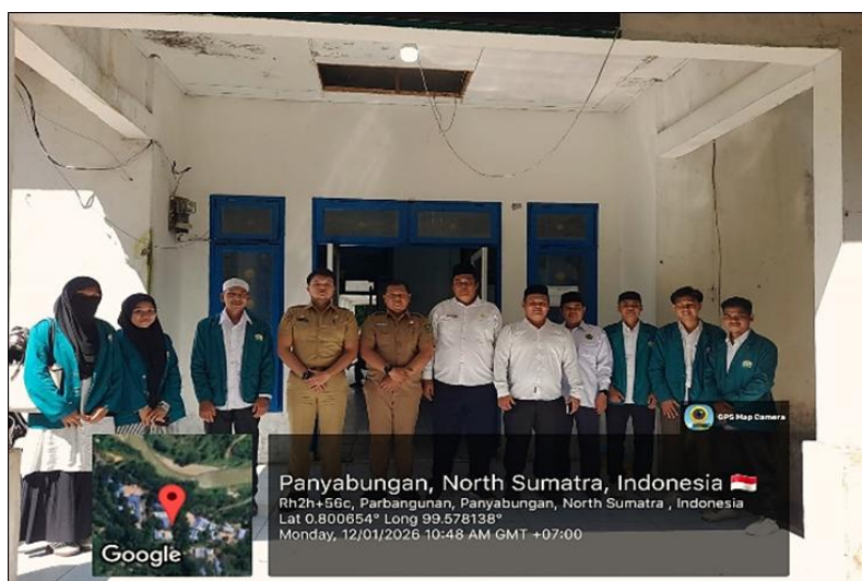
Gambar 2. Kedatangan Mahasiswa PPL di Dinas PMD Kabupaten Mandailing Natal

Dinas Pemberdayaan Masyarakat dan Desa (PMD) Kabupaten Mandailing Natal menjadi mitra utama pelaksanaan PPL yang dilaksanakan oleh tujuh mahasiswa dan dosen pembimbing lapangan dari STAIN Mandailing Natal di wilayah administrasi Kabupaten Mandailing Natal. Kegiatan pengabdian berlangsung secara terpadu dan berlangsung mulai kedatangan lapangan, pendataan, pendampingan sampai verifikasi administrasi di beberapa kecamatan termasuk Kecamatan Panyabungan. Pada tahap awal, tim PPL melakukan koordinasi administratif, menerima pengarahan dari staf dinas, serta mengikuti orientasi lapangan yang memaparkan tugas, mekanisme pelaporan, dan jadwal kerja harian. Proses administrasi awal dan pembagian tugas menjadi fondasi agar kegiatan di lapangan dapat berjalan terukur dan terarah sesuai alur metodologis yang telah disepakati.