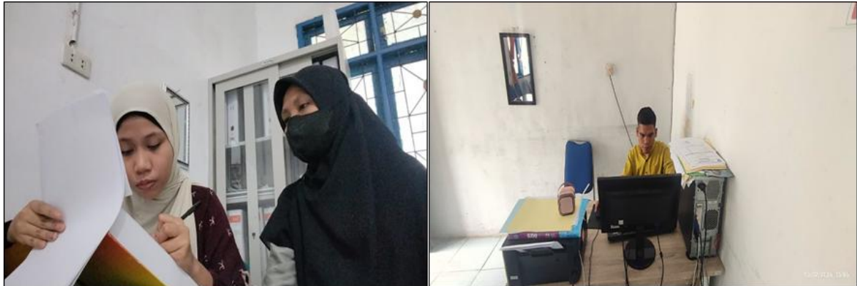
Gambar 4. Verifikasi dan Validasi Data Keuangan Desa, Lembaga, dan Administrasi Desa

memeriksa kelengkapan bukti transaksi, dan membantu menyusun daftar perbaikan administrasi yang ditemukan selama verifikasi. Selain itu, terdapat kegiatan pendampingan proses pengajuan pencairan dana desa yang membutuhkan koordinasi intensif dengan pihak terkait. Pelaksanaan tugas ini menuntut ketelitian administratif dan pemahaman prosedur keuangan desa agar sistem pelaporan dan akuntabilitas dapat dipenuhi sesuai ketentuan.