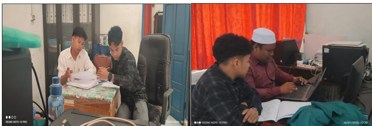
Gambar 3. Pendataan Pembinaan dan Pendampingan Desa di Kecamatan Panyabungan

Kegiatan pendataan dalam rangka pembinaan dan pendampingan pemberdayaan desa menjadi salah satu aktivitas utama tim PPL selama periode pelaksanaan. Pelaksanaan pendataan dilakukan secara partisipatif bersama perangkat desa, mencakup identifikasi kebutuhan, inventarisasi kelembagaan, serta pendataan potensi ekonomi lokal. Tim PPL menerapkan teknik observasi partisipatif dan wawancara terstruktur, serta mendokumentasikan temuan. Proses pendataan ini dilakukan dengan prinsip verifikasi silang, memeriksa data melalui dokumen desa, wawancara dengan informan kunci, dan diskusi kelompok agar informasi yang terkumpul valid serta bisa menjadi dasar untuk kegiatan pendampingan berikutnya.